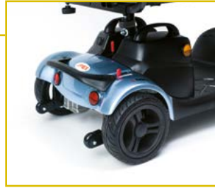
Palanca de desembrague y ruedas antivuelco