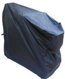
Funda de almacenaje