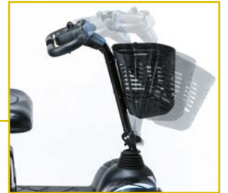
Columna de conducción