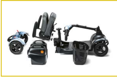
Desmontable en 4 piezas