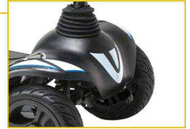
Luz led delantera