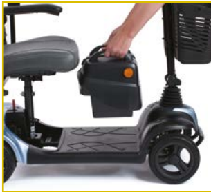
Baterías extraíbles para facilitar su recarga